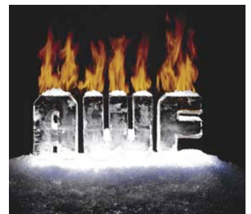
Fluido de Compresor Sullair AWF Mejora la lubricación en climas cálidos y fríos. Vida prolongada del fluido del compresor. Garantía extendida en la unidad compresora.