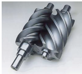
Diseño de Tornillo Rotativo de Sullair. El pionero en tecnología de Tornillo Rotativo.