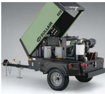
Cubierta articulada de fácil acceso Diseño liviano y compacto.